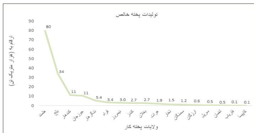
گراف ۲: تولیدات پخته به تفکیک ولایات در سال ۱۴۰۳

ارقام بدست آمده نشان می دهد که حدود ۱۵ فیصد دهاقین مصاحبه شده از اثر کمبود آب، ۱۶ فیصد به اثر ضعف اقتصاد، ۹ فیصد به اثر کمبود عوامل تولید، ۲۳ فیصد از اثر کمبود آب و ضعف اقتصاد، ۲۱ فیصد از اثر هر سه عوامل، ۳ فیصد از اثر کمبود آب و عوامل تولید و بالاخره ۱۳ فیصد از اثر ضعف اقتصاد و کمبود عوامل تولید متضرر گردیده و سبب کاهش تولیدات پخته شان گردیده است. قابل یاد آوری می دانیم که فیصدی های ذکر شده به سطح کشور بوده که به تفکیک هر ولایت متفاوت می باشد. چگونگی تولیدات پخته به تفکیک ولایات را می توان در گراف ذیل ملاحظه نمود.