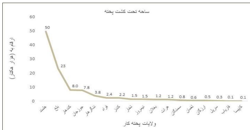
گراف ۲: ساحه تحت کشت پخته به تفکیک ولایات در سال ۱۴۰۳

نبات پخته همه ساله در یک تعداد ولایات کشور زرع گردیده که محصولات آن بیشتر در صنعت مورد استفاده قرار می گیرد. به اساس نتایج سروی قطع نبات پخته در سال ۱۴۰۳ پخته در ۱۷ ولایت کشور زرع گردیده که حدود ۱۰۵ هزار هکتار ساحه تحت کشت را به سطح کشور احتوا نموده و به مقایسه سال گذشته ۱۲ فیصد افزایش را دارا می باشد. ولایات هلمند و بلخ به مقایسه سایر ولایات پخته کار دارای بیشترین ساحات تحت کشت پخته در سال جاری می باشند. این در حالی است که ولایات فاریاب و کاپیسا دارای کمترین ساحات کشت پخته می باشند. گراف ذیل ساحه تحت کشت پخته را به تفکیک ولایات نشان می دهد: