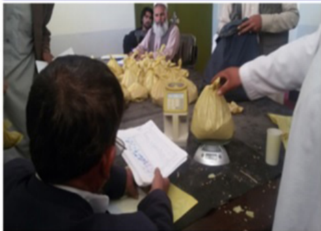
مرحله وزن و سنجش رطوبت دانه ها