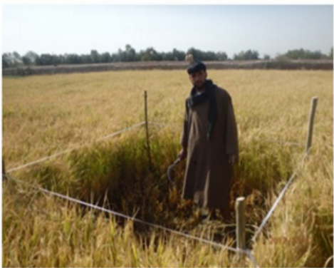
مرحله قطع نبات

تصاویر ذیل مراحل مختلف تطبیق سروی قطع شالی را در ساحه نشان میدهد