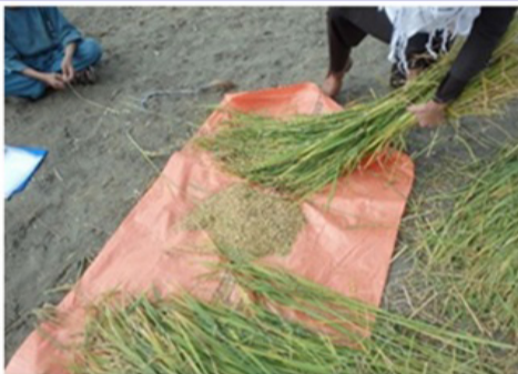
مرحله جدا کردن دانه ها

کلان شهروندان افغانستان به شمار می‌رود و استفاده از آن به صورت گسترده صورت می‌گیرد. به گزارش این سروی مشترک وزارت زراعت و اداره ملی احصایه، کندز با داشتن ۴۶.۸ هزار هکتار شالی‌زار و تولید ۱۴۰ هزار متریک تن برنج، جایگاه اول ولایات تولیدکننده برنج را دارد. تخار با داشتن ۲۳ هزار هکتار شالی‌زار و تولید ۷۵ هزار تنی، جایگاه دوم، بغلان با داشتن ۱۹.۷ هزار هکتار شالی‌زار و تولید ۶۳ هزار تنی جایگاه سوم و ننگرهار با داشتن ۱۴.۶ هزار هکتار شالی‌زار و تولید ۴۷ هزار تن برنج در جایگاه چهارم قرار دارد. هرات با تولید ۲۸ هزار تنی، کنر با تولید ۲۰ هزار تنی، بلخ با تولید ۱۸ هزار تنی و لغمان با تولید ۱۵ هزار تنی در جایگاه‌های بعدی قرار دارند. خوست، ارزگان، پکتیا، بدخشان، دایکندی، کابل، بادغیس، هلمند، بامیان، سرپل و غور، از ولایت‌های بعدی تولیدکننده برنج در کشور اند. باید گفت ساخت شبکه‌های آبیاری، راه‌اندازی برنامه‌های آموزشی، ایجاد مزرعه‌های نمایشی شالی و کمک به شالی‌کاران توسط وزارت زراعت، منجر به افزایش کشت گردیده و نیز باعث بیش‌تر شدن حاصلات شالی در میان دهقانان شده است. به اساس تخمین اداره ملی احصایه و معلومات، نیاز افغانستان به برنج در سال ۱۳۹۹، ۶۵۵ هزار تن است که با توجه به میزان تولید، ۲۱۵ هزار تن کمبود وجود دارد.