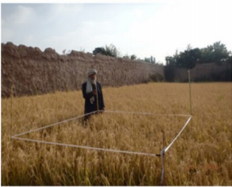
مرحله چوکات بندی