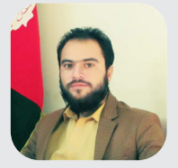
کجه نورالله پتمن خبريال